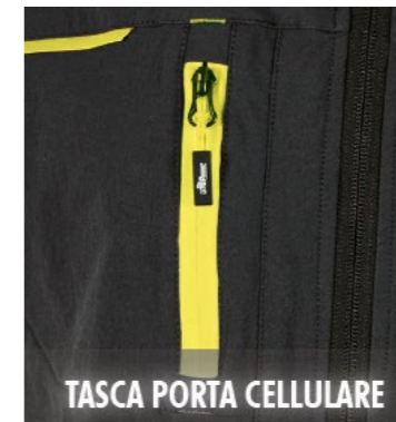
TASCA PORTA CELLULARE