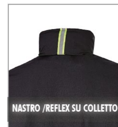
NASTRO /REFLEX SU COLLETO