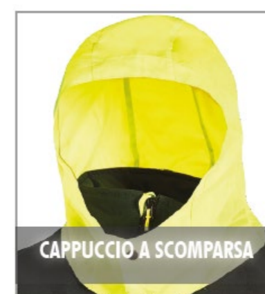
CAPPUCCIO A SCOMPARSA