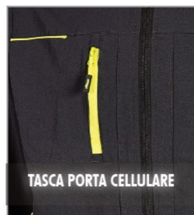
TASCA PORTA CELLULARE